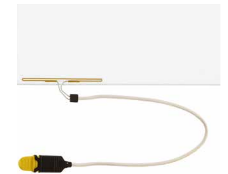
Alarmdraht mit Randanschluss

Bruchbild die Leiterschleife unterbrochen und der Alarm ausgelöst.